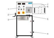
1 élément d'entraînement de la courroie, 2 broche de dispositif de tension de la courroie trapézoïdale, 3 résistance de charge, 4 fermeture à genouillère, 5 bride de montage du dispositif de tension, 6 trappe de service transparente, 7 tête de protection de la courroie trapézoïdale