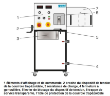
1 élément d'affichage et de commande, 2 broche du dispositif de tension de la courroie trapézoïdale, 3 résistance de charge, 4 fermeture à genouillère, 5 entretoise de réglage du dispositif de tension, 6 trappe de service transparente, 7 tôle de protection de la courroie trapézoïdale