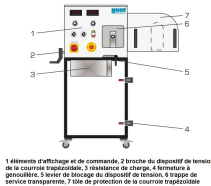
1 élément d'affichage et de commande, 2 broche du dispositif de tension de la courroie trapézoïdale, 3 résistance de charge, 4 fermeture à genouillère, 5 entre de serrage du dispositif de tension, 6 trappe de service transparent, 7 tôle de protection de la courroie trapézoïdale