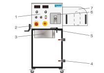
1 élément d'affichage et de commande, 2 broche du dispositif de tension de la courroie trapézoïdale, 3 résistance de charge, 4 fermeture à genouillère, 5 entretoise de réglage du dispositif de tension, 6 trapèze de service transparent, 7 tôle de protection de la courroie trapézoïdale