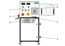
1 élément d'affichage et de commande, 2 broche du dispositif de tension de la courroie trapézoïdale, 3 valance de dragage, 4 interrupteur à genouillère, 5 servit de réglage du dispositif de tension, 6 trappe de service transparente, 7 tôle de protection de la courroie trapézoïdale