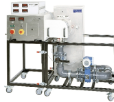
1 élément d'affichage et de commande, 2 broche du dispositif de tension de la courroie trapézoïdale, 3 valance de dragage, 4 interrupteur à genouillère, 5 servit de réglage du dispositif de tension, 6 trappe de service transparente, 7 tôle de protection de la courroie trapézoïdale

Le HM 365 est le module de base de la série FEMLine; il permet de réaliser des études et des expériences sur des machines à fluide.