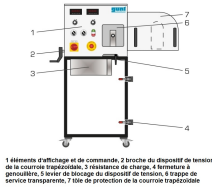
1 élément d'affichage et de commande, 2 broche du dispositif de tension de la courroie trapézoïdale, 3 résistance de charge, 4 fermeture à genouillère, 5 entretoise de réglage du dispositif de tension, 6 trapèze de service transparent, 7 tôle de protection de la courroie trapézoïdale