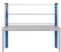
Table équipée d'une console d'alimentation, cadre de montage, cadre mobile pour le groupe frigo

Ce poste de travail/laboratoire permet le montage d'un banc d'essai complet en combinaison avec l'unité de base ET 910 et les kits de complément ET 910.10 et ET 910.11 ainsi que le kit d'accessoires ET 910.12.