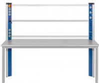
Table équipée d'une console d'alimentation, cadre de montage, cadre mobile pour le groupe frigo

Ce poste de travail/laboratoire permet le montage d'un banc d'essai complet en combinaison avec l'unité de base ET 910 et les kits de complément ET 910.10 et ET 910.11 ainsi que le kit d'accessoires ET 910.12.