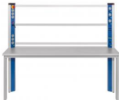
Table équipée d'une console d'alimentation, cadre de montage, cadre mobile pour le groupe frigo

Ce poste de travail/laboratoire permet le montage d'un banc d'essai complet en combinaison avec l'unité de base ET 910 et les kits de complément ET 910.10 et ET 910.11 ainsi que le kit d'accessoires ET 910.12. Le poste de travail/laboratoire se compose d'une table équipée d'une barrette d'alimentation, un bâti pour la réception des composants, un conteneur à roues et un cadre mobile pour le groupe frigorifique.