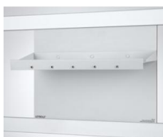
Table pour électrochimie CPS pour 664 407

À utiliser avec l'appareil de démonstration Électrochimie, CPS ( 664 4071 ) ; pour les cuves à électrolyse et les tubes en U (avec fiches à ressort 59121 ) pour l'exécution d'expériences de démonstration en électrochimie.