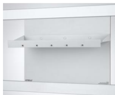
Table pour électrochimie CPS pour 664 407

À utiliser avec l'appareil de démonstration Électrochimie, CPS ( 664 4071 ) ; pour les cuves à électrolyse et les tubes en U (avec fiches à ressort 59121 ) pour l'exécution d'expériences de démonstration en électrochimie.