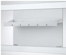
Table pour électrochimie CPS pour 664 407

À utiliser avec l'appareil de démonstration Électrochimie, CPS ( 664 4071 ) ; pour les cuves à électrolyse et les tubes en U (avec fiches à ressort 59121 ) pour l'exécution d'expériences de démonstration en électrochimie.