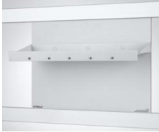
Table pour électrochimie CPS pour 664 407

À utiliser avec l'appareil de démonstration Électrochimie, CPS ( 664 4071 ) ; pour les cuves à électrolyse et les tubes en U (avec fiches à ressort 59121 ) pour l'exécution d'expériences de démonstration en électrochimie.