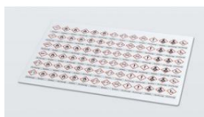
Planche d'étiquettes avec mentions d'avertissement selon le SGH